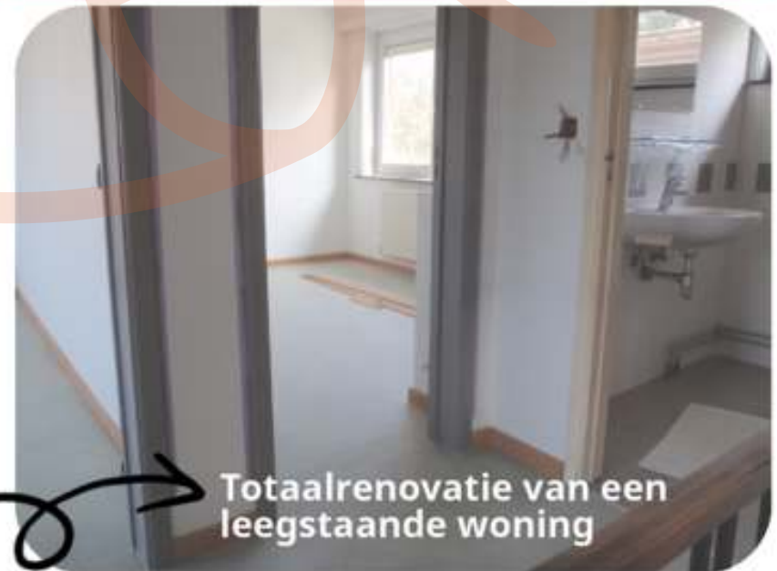
Totaalrenovatie van een leegstaande woning

Van zodra Providentia dan een aanvraag tot maandelijks afbetaling via MyTrustO ontvangt, zullen wij onze medewerking hieraan verlenen.